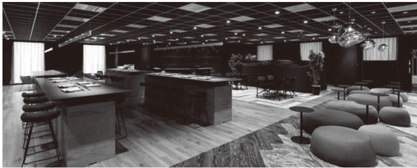
図1 | サテライトオフィス「@Terrace」の内観 東京・八重洲に新設されたサテライトオフィス「@Terrace」は、日立グループの全従業員が利用できる。

フィス「Biz Terrace（ビズテラス）」を開設した。日立のオフィスと同等のセキュリティ環境を備えた、利用登録したビジネスユニット・部門、グループ会社が使用可能な会員制のサテライトオフィスであり、2018年3月時点で8拠点、1日当たりの利用者は延べ2,000人を超えている。